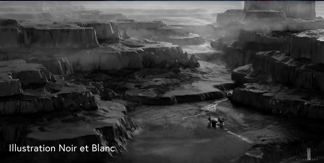
Illustration Noir et Blanc